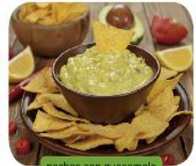
nachos con guacamole