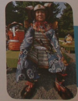
Los samuráis eran los antiguos guerreros japoneses. Se protegían con una armadura y un casco.