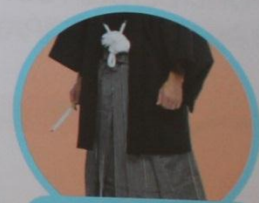
Hakama es un pantalón largo con pliegues.