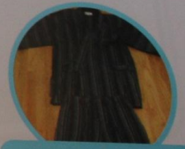
Jinbei es la ropa que se usa para estar en casa.