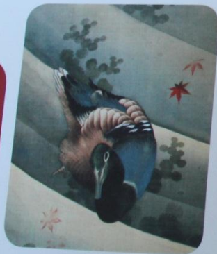
Pato nadando en el agua.