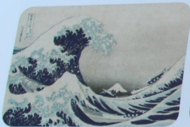
La gran ola de Kanagawa.

HOKUSAI FUE UN PINTOR FAMOSO POR REPRESENTAR MOMENTOS DE LA VIDA COTIDIANA DE JAPÓN.