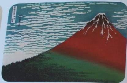
Viento del sur, cielo claro.