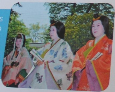
El jūnihitoe es el kimono utilizado por las damas de la casa imperial. Tiene doce capas de seda.