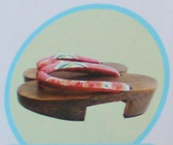
Geta es el calzado japonés de madera.