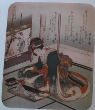
Una mujer hace una miniatura del monte Fuji.

Hokusai realizó más de treinta pinturas del monte Fuji. ¿Lo ves en alguno de estos cuadros?