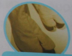
Tabi son los calcetines que se usan con las sandalias.