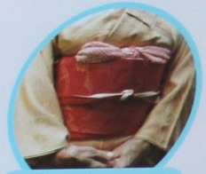
Obi es un cinturón ancho que se lleva sobre el kimono.

HOY, LOS JAPONESES VISTEN COMO LOS EUROPEOS. SIN EMBARGO, USAN EL KIMONO PARA ALGUNAS CELEBRACIONES Y OTRAS OCASIONES ESPECIALES.